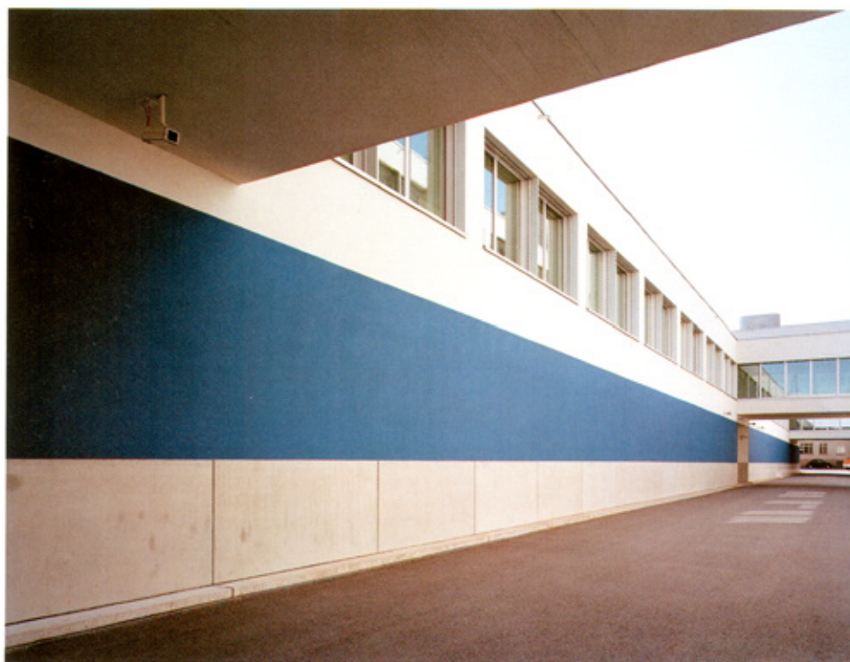
Der Innenhof des Bürogebäudes am Soodring 33 in Adliswil.

Für Swiss Re, einen der grössten Rückversicherer der Welt, ist Kunst ein wichtiger Bestandteil des gesamten Firmenimages. Sie ist, eingebettet in anspruchsvolle historische und zeitgenössische Architektur, von der sie untrennbar ist, der sichtbare Ausdruck der Firmenwerte. Sie visualisiert das, was sonst für den Aussenstehenden fast nicht wahrnehmbar ist: die Tradition, die Erfahrung, das Know-how, die Verlässlichkeit, alles erworben in über 140-jähriger Aufbauarbeit und den meisten doch weitgehend unbekannt. Der in der breiten Öffentlichkeit wenig positionierten Brand «Swiss Re» wurde mit Ikonen verbunden, von denen der sogenannte Swiss-Re Tower an 30, St Mary Axe in London, dieser konische, gläserne, 180 m hohe Turmkörper als bekanntestes Element der Londoner Skyline, wohl die populärste, aber bei weitem nicht die einzige ist.