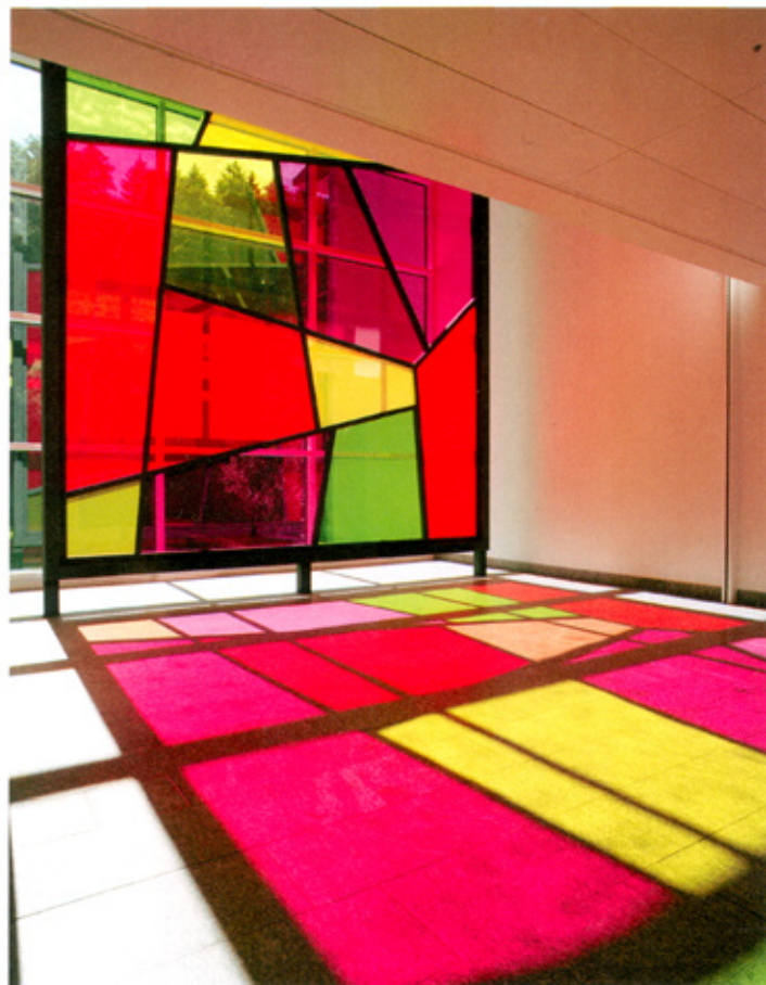
Anselm Reyle, Ohne Titel (für Otto Freundlich), 2007.