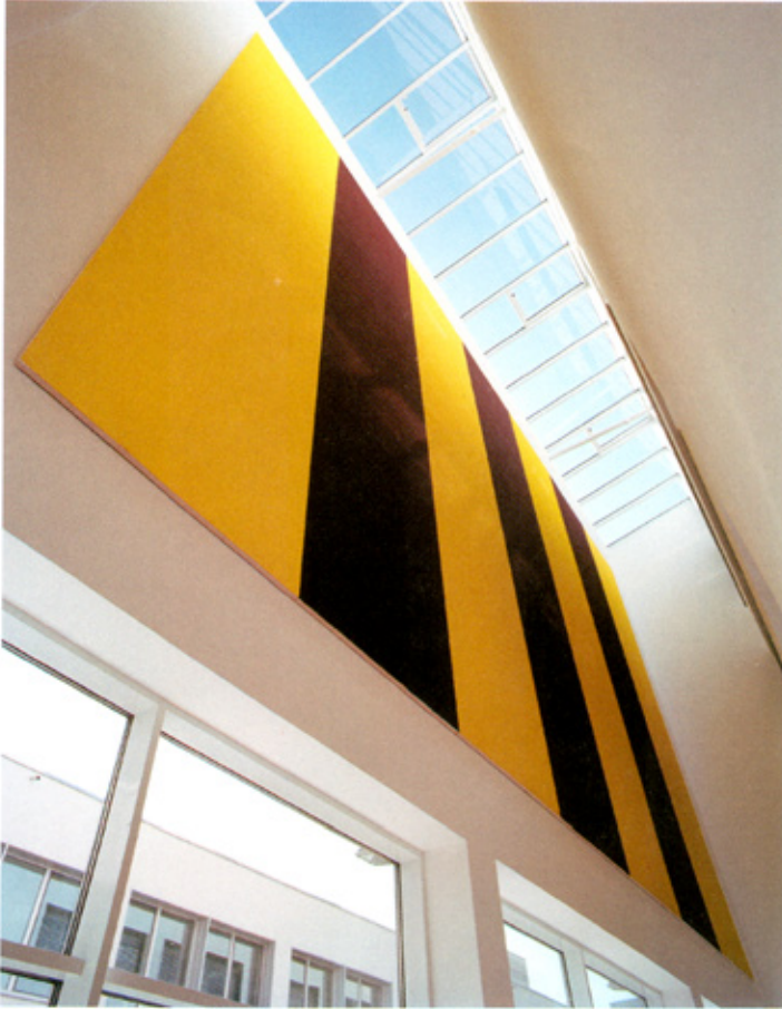
Olivier Mosset, Sketch II, 2006.