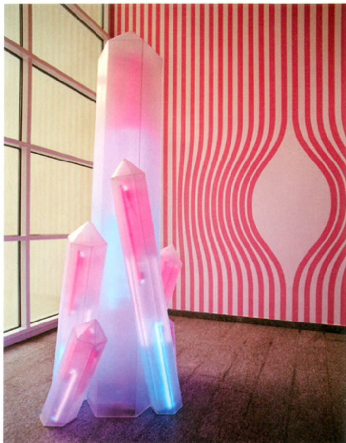
Sylvie Fleury, Eternal Wow with Quartz, 2007.